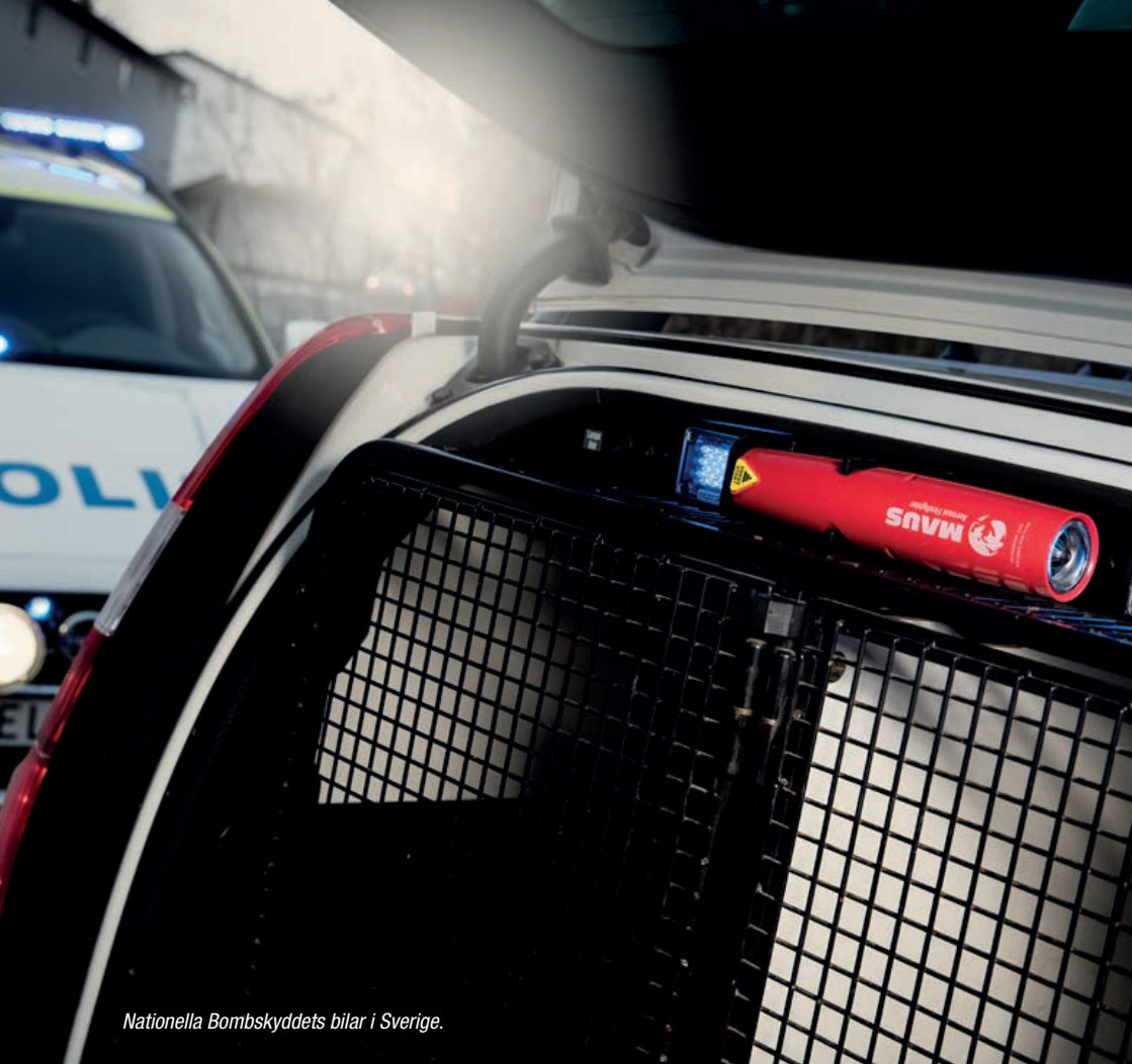
Nationella Bombskyddets bilar i Sverige.