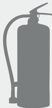
4 KG 2KG PULVER 38,5 x 12,3 x 12 cm Verklig vikt: 4 kg