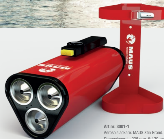
Art nr: 3001-1 Aerosolsläckare: MAUS Xtin Grand. Dimensioner: L: 236 mm, Ø 120 mm. Vikt: 1750 gram. Brandklasser: 21 BC. Certifierad av Rina S.p.A & CE-märkt.

Förläng båtsäsongen med MAUS. Förstör inte båten med pulver – om du inte verkligen måste. Lova dig själv att alltid använda MAUS först och bespara dig mycket tid och pengar om olyckan skulle vara framme. Med framtidens brandsläckare kan du ta dig hem för egen maskin, precis som familjen Goncharoff. Aerospaceteknologi som tar dig säkert hem.